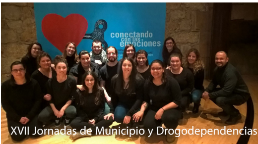
XVII Jornadas de Municipio y Drogodependencias