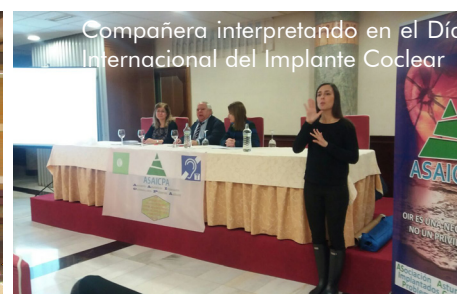
Compañera interpretando en el Día Internacional del Implante Coclear