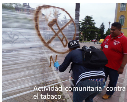
Actividad comunitaria "contra el tabaco"