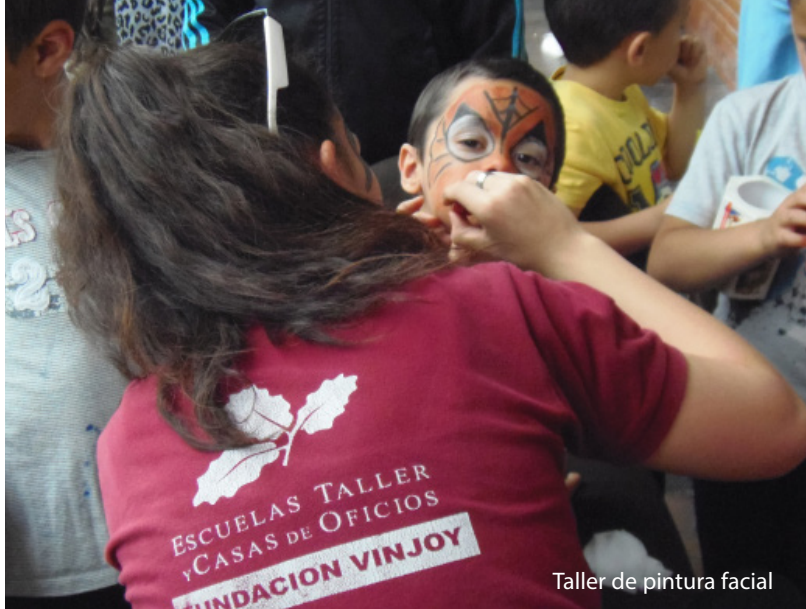
Taller de pintura facial