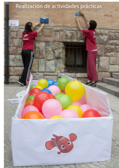
Realización de actividades prácticas