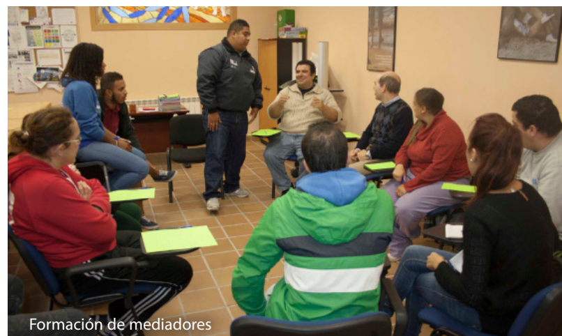
Formación de mediadores