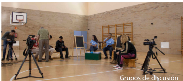
Grupos de discusión