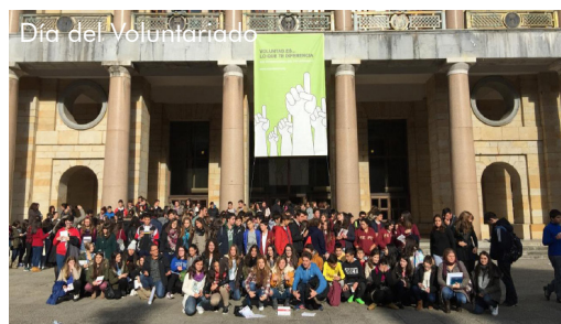
Día del Voluntariado