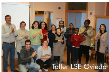
Taller LSE Oviedo