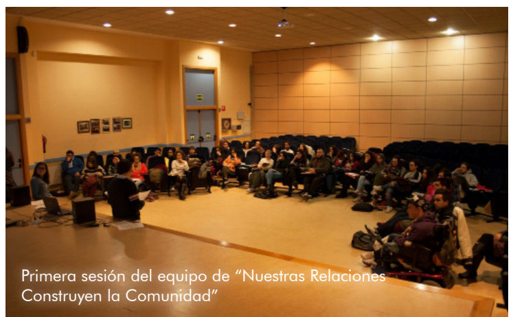
Primera sesión del equipo de “Nuestras Relaciones Construyen la Comunidad”