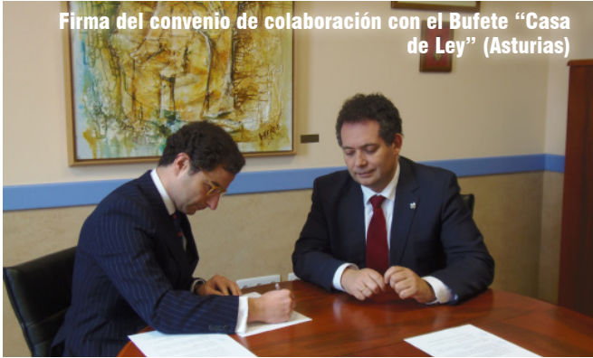
Firma del convenio de colaboración con el Bufete "Casa de Ley" (Asturias)