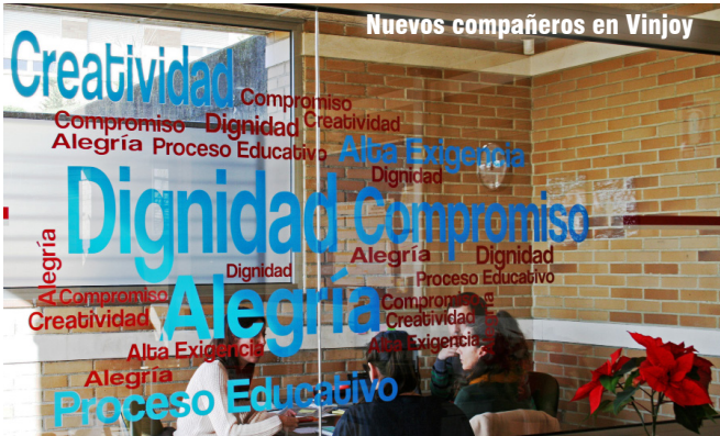
Nuevos compañeros en Vinjoy