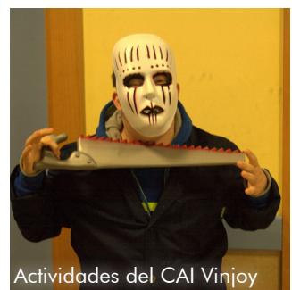
Actividades del CAI Vinjoy