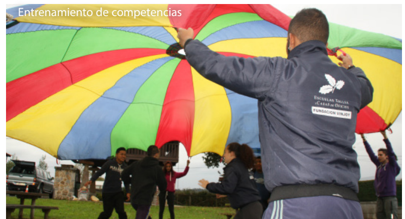
Entrenamiento de competencias