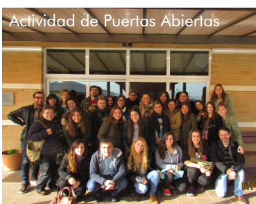
Actividad de Puertas Abiertas