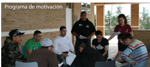
Programa de motivación