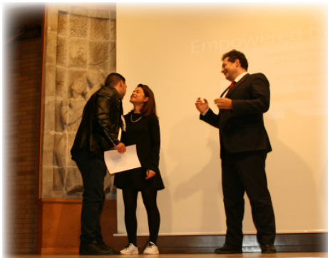
Momento del Acto de Clausura, celebrado el 23 de febrero.