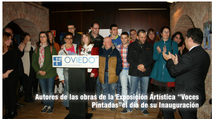
Autores de las obras de la Exposición Artística "Voces Pintadas" el día de su Inauguración