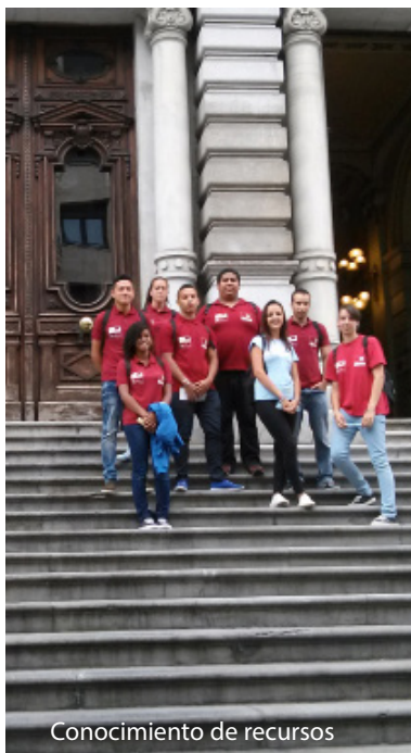
Conocimiento de recursos

A continuación os mostramos en imágenes algunas de las actividades desarrolladas.