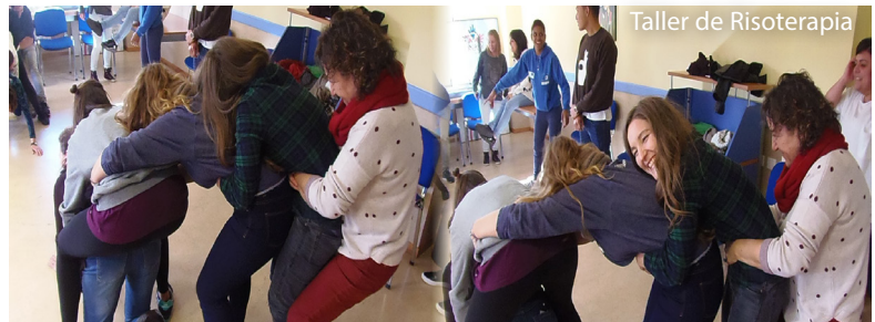
Taller de Risoterapia