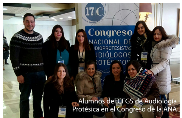
Alumnos del CFGS de Audiología Protésica en el Congreso de la ANA

Los pasados 28 y 29 de noviembre se celebró en Madrid el Congreso Anual Nacional de Audioprotesistas/Audiólogos Protésicos. Como en ocasiones anteriores, acudió al mismo buena parte del alumnado de segundo curso del ciclo formativo. El programa de actividades incluye temas como rendimientos en el audífono, nuevos enfoques en la audiometría verbal, pruebas audiológicas encaminadas a la detección de sorderas centrales, validación y verificación de la eficacia de las adaptaciones, la adaptación protésica en la persona mayor, transposición frecuencias, entrenamiento auditivo, y un largo etc. Desde aquí agradecer a la organización el detalle que tienen siempre con los estudiantes de segundo curso, al subvencionar la ANA la cuota de participación.