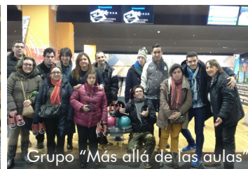
Grupo "Más allá de las aulas"

Otras iniciativas de Participación Social y Desarrollo Comunitario: