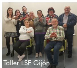
Taller LSE Gijón

Repetimos una nueva edición de los Talleres de Técnicas de Comunicación con Soporte en Lengua de Signos y recursos técnicos dirigidos, uno de ellos a personas adultas con déficit auditivo y personas con implante coclear y el otro dirigido a familias con hijos con discapacidad (con 2 grupos), con 7 y 12 participantes respectivamente.