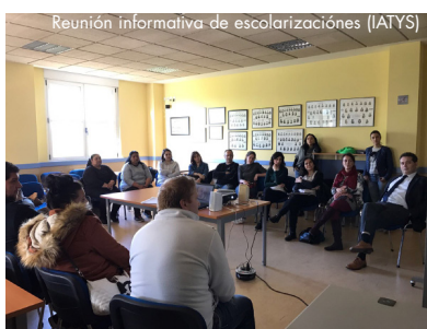
Reunión informativa de escolarizaciones (IATYS)