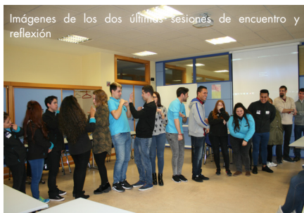
Imágenes de los dos últimos sesiones de encuentro y reflexión

Infórmate llamando al: 633102825 o envíanos un Whatsapp