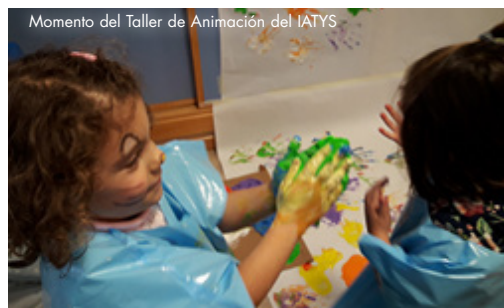
Momento del Taller de Animación del IATYS