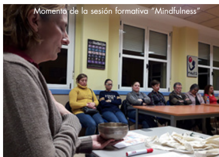
Momento de la sesión formativa "Mindfulness"

Con el fin de mejorar la información y orientación durante este proceso, las familias se reunieron la pasada semana, con el equipo del Instituto de Atención Temprana y Seguimiento y el Equipo Regional de la Consejería de Educación.